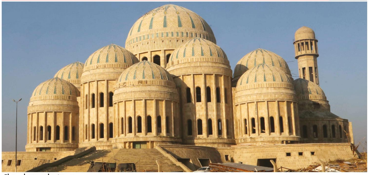
مسجد جامع موصل ، عراق